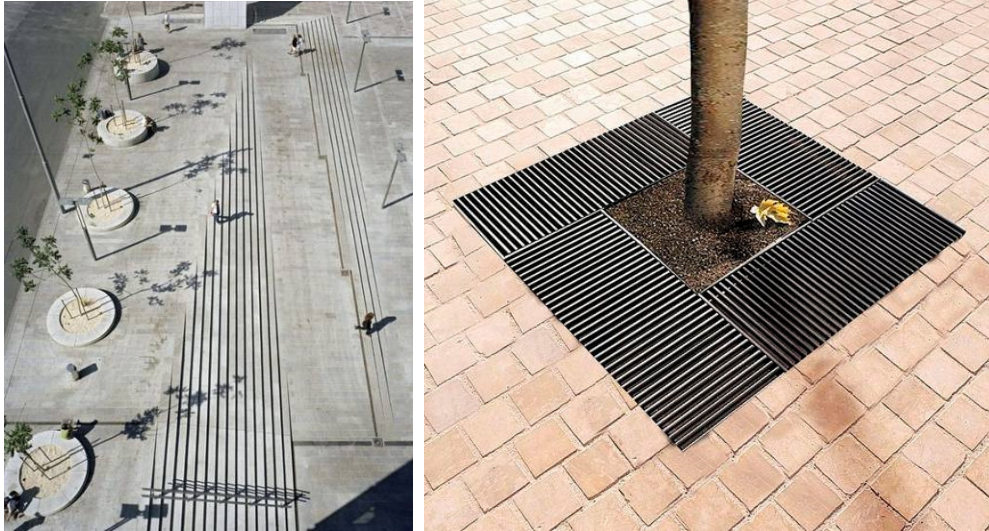
11-12 pav. Terasų – laiptų, medžio kietoje dangoje pavyzdžiai

Aikštėje sodinami medžiai (kietų dangų zonose) bus sodinami dangos lygyje, įrengiant apsaugines metalines grotelės. Vakariniėje aikštės dalyje (K. Donelaičio g. priegose) pavieniai medžiai sodinami klombose.