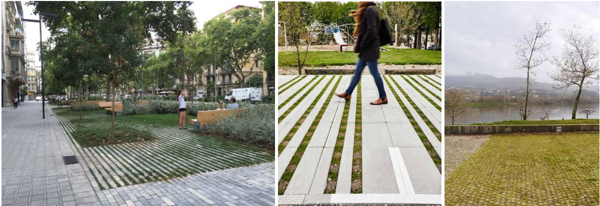
5-7 pav. Korėtos dangos įrengimo pavyzdžiai

Žemiau pateikiami siūlomų įrengti dangų ir kitų mažosios architektūros elementų pavyzdžiai (analogai) bei įrengimo principai.