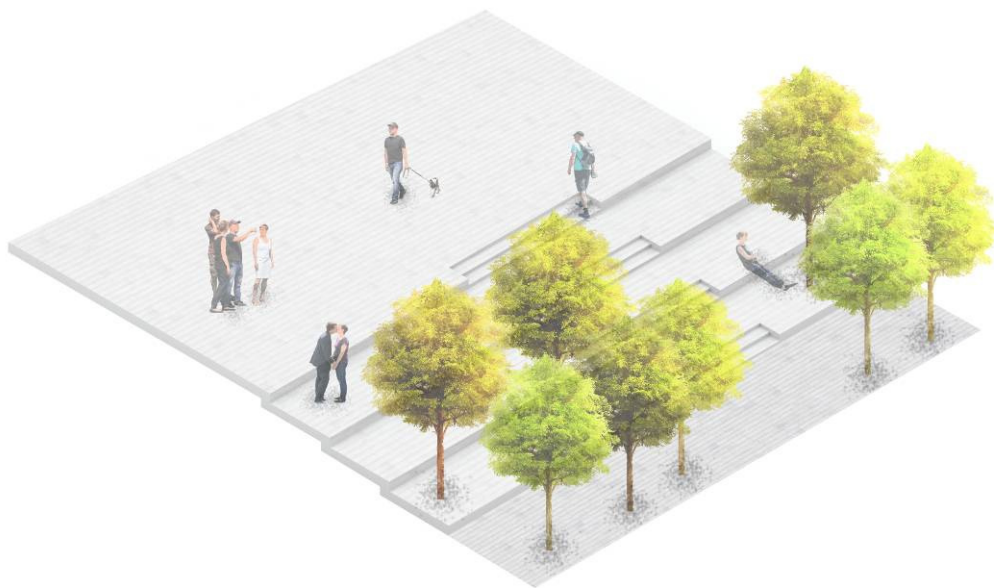
2 pav. Įrengiamų terasų su laiptais fragmentas

Šiaurinėje ir vakarinėje aikštės pusėse, po pavieniais medžiais ar jų grupėmis siūlome įrengti sėdimas platformas – suolus, integruotus į formuojamų klombų atramines sienutes. Tokiu principu įreminami tiek pavieniai medžiai (ties K. Donelaičio g.), tiek jų grupės (šiaurinėje dalyje).