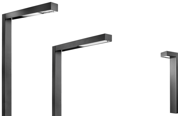
13 pav. Šviestuvų pavyzdžiai

Aikštės apšvietimui siūlome įrengti modernius, tačiau santūrios stilistikos šviestuvus. Lokaliai (atskirų zonų, integruotų suolų ir pan.) apšvietimui siūlome naudoti į atramines sienutes ir grindinio dangas įmontuojamus šviestuvus.