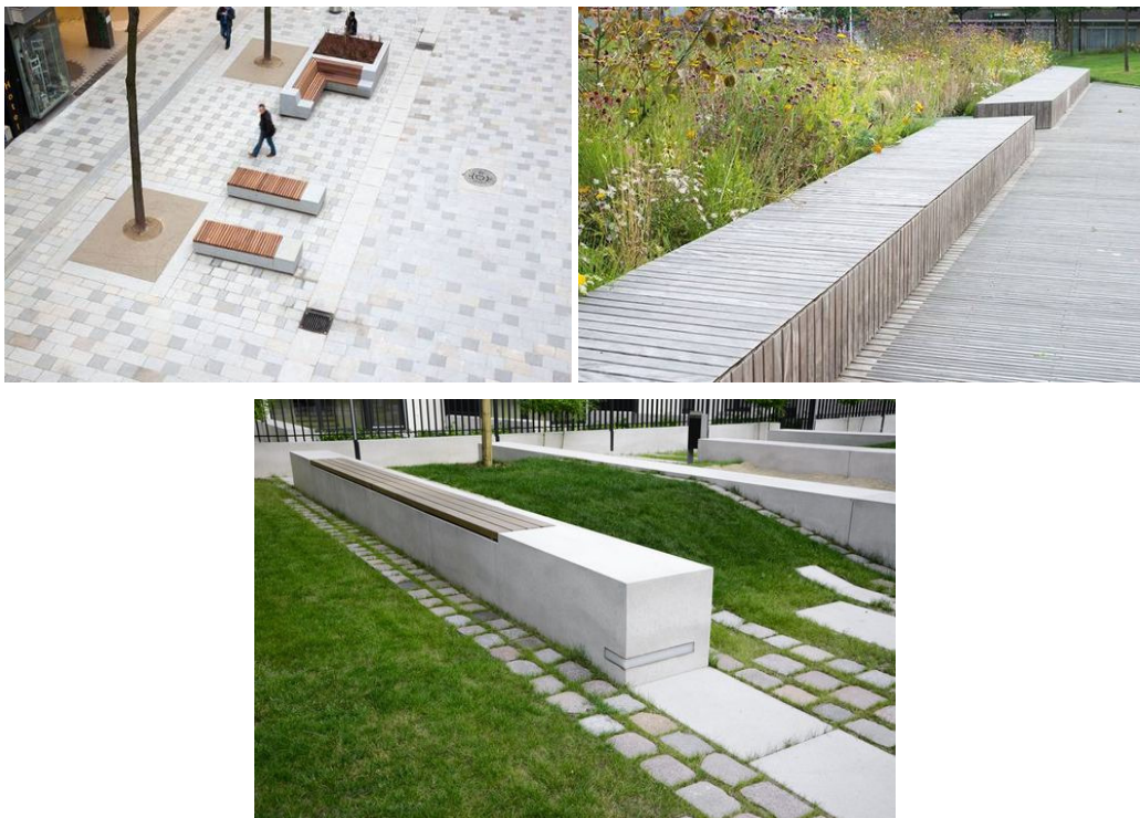
8-10 pav. Suolų ir sėdimų plokštumų įrengimo pavyzdžiai

Suolai ir sėdimos platformos įrengiamos visoje aikštės teritorijoje. Vakarinėje dalyje įrengiamos pavieniai medžiai įreminančios suolų grupės su medinėmis sėdimomis dalimis. Šiaurinėje teritorijos dalyje sėdimos medinės plokštumos įrengiamos ant formuojamų medžių klombų viršutinių plokštumų (briaunų).