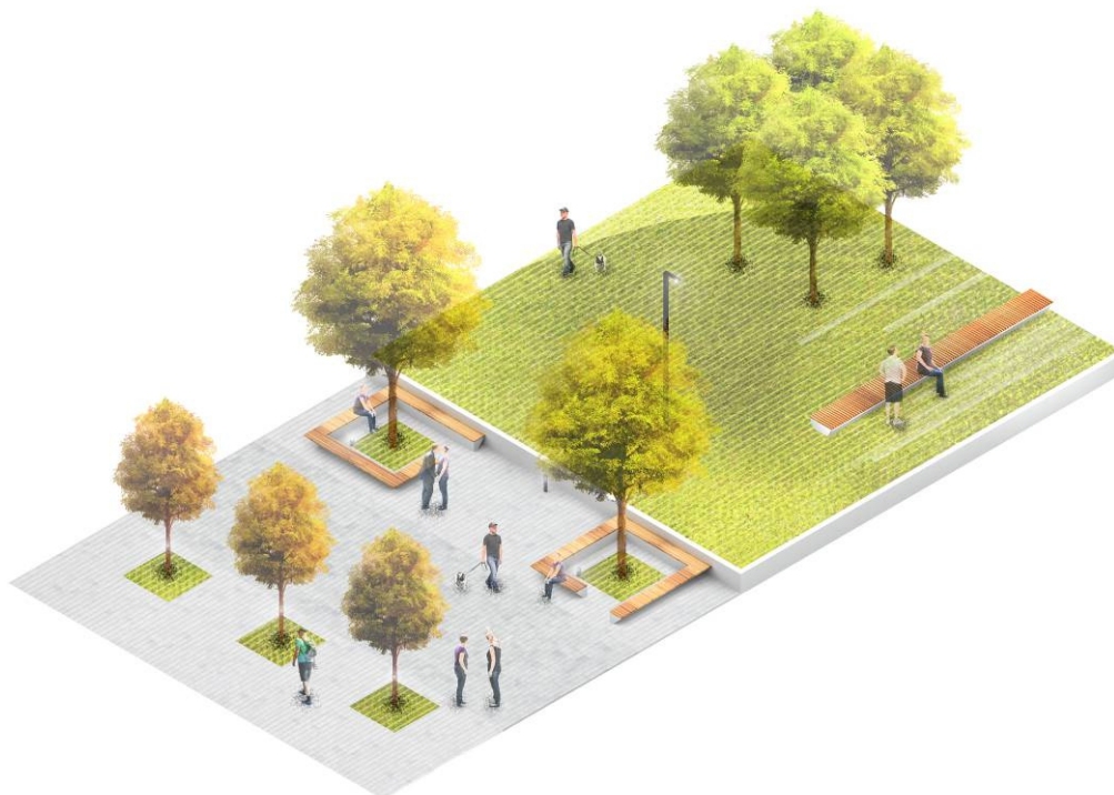
3 pav. Pertvarkomos K. Donelaičio g. išklotinės fragmentas

Šiaurinėje ir vakarinėje aikštės pusėse, po pavieniais medžiais ar jų grupėmis siūlome įrengti sėdimas platformas – suolus, integruotus į formuojamų klombų atramines sienutes. Tokiu principu įreminami tiek pavieniai medžiai (ties K. Donelaičio g.), tiek jų grupės (šiaurinėje dalyje).