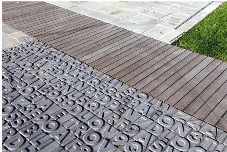
5 pav. Paminklo K. Donelaičiui prieigos įrengimo pavyzdys

Esamas paminklas su postamentu restauruojamas – nuplaunamas, sutvirtinami pažeisti kompozicijos fragmentai ir kt.